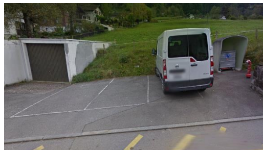
Parkplätze / Abfall