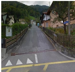
Zugang zu Fuss

Umgebung: Das Haus liegt unterhalb eines steilen Hanges, zur Sicherung wurde 2018 ein Murgangschutz installiert. Dieser dient der Sicherheit der Mieter und nicht als Klettergerüst. Der Hang oberhalb des Hauses soll mit Vorsicht begangen werden vor allem bei anhaltendem Regen.